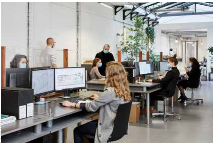
L'agence Lemoal Lemoal se trouve rue du Château-d'Eau dans le 10 e arrondissement de Paris. Elle a récemment livré le pôle social et culturel de Cabourg ainsi qu'un club house de Tennis dans la même ville. Les deux frères ont également une agence à Rennes.

et de nos missions peut se faire en télétravail, il y a très vite une limite puisqu'on perd la dimension improvisation. Beaucoup d'idées et de décisions se prennent à contretemps d'une réunion dédiée au projet en question. Le formatage de la visioconférence ne le permet pas. La sérendipité qui est essentielle disparaît avec le télétravail tout comme la transversalité. Dans une agence, grâce à la présence physique, il y a un foisonnement qui fait que les équipes se croisent. En distanciel, chacun est assigné à sa tâche et c'est un vrai problème pour la créativité. Si, à terme, crise ou non, le télétravail devait se généraliser, ce serait un véritable asservissement pour les architectes qui se retrouveraient cantonnés à leur seule mission sans possibilité de profiter de l'ébullition propre à l'activité d'une agence. »